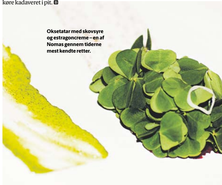
Oksetatar med skovsyre og estragoncreme – en af Nomas gennem tiderne mest kendte retter.